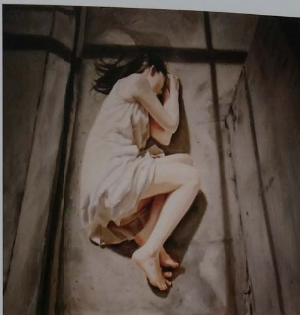
鈴木那奈《追憶》116.7x116.7cm キャンバスに油彩 2016年