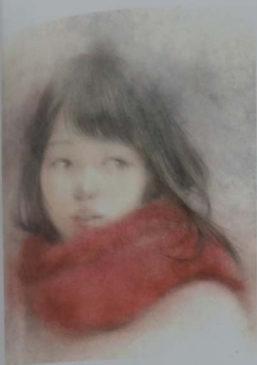
山崎カズヒコ《霜月》4F パステルほかミクストメディア、画用紙 2016年

2017年1月号の月刊美術46P、146pに『銀座かわうそ画廊』を掲載いただきました。