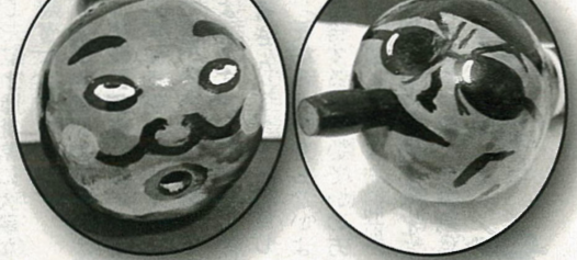
左上から時計回りに菅、安倍、麻生、石破の各氏