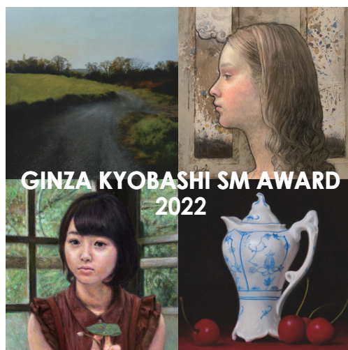
GINZA KYOBASHI SM AWARD 2022